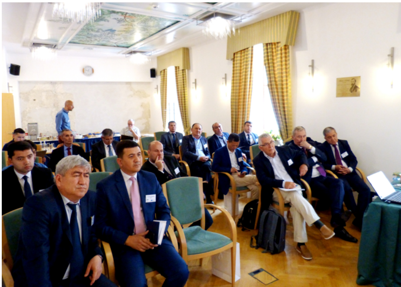
Фото: ТИҚХММ институти ахборот хизмати

Мазкур лойиҳа доирасида 2017-2020 йилларда Ўзбекистондан жами 15 нафар фалсафа фан докторлари (PhD) тайёрланади ва 20 нафар илмий раҳбар ҳамда илмий маслаҳатчилар илмий педагог кадрларни тайёрлаш бўйича лойиҳанинг Европадаги ҳамкор ОТМлари – Обуда университети (Венгрия), Зальцбургдаги Париж Лодрон университети (Австрия), Қироллик технология институти (Швеция), Қишлоқ хўжалигини ривожлантириш Лейбниц институти (Германия)да малака оширишга юборилиши билан бир қаторда геоахборот тизим ва технологиялари (GIS) йўналиши бўйича 18 та илмий оммабоп адабиётлар ҳаммуаллифликда яратилади ва лойиҳа ҳисобидан чоп этилади.