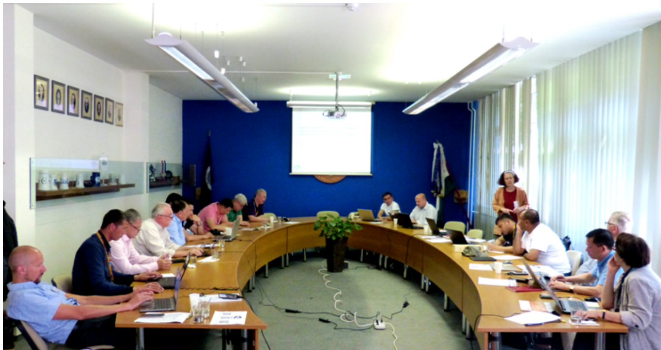
Фото: ТИҚХММ институти ахборот хизмати

(ТИҚХММИ) бошчилигида Мирзо Улуғбек номидаги Ўзбекистон миллий университети, Қорақалпоқ давлат университети, Самарқанд давлат архитектура ва қурилиш институти ҳамда Тошкент архитектура ва қурилиш институтидан жами 17 нафар ходим, шунингдек, лойиҳанинг Европа Иттифоқидаги ҳамкор ОТМлари вакиллари иштирок этишди.